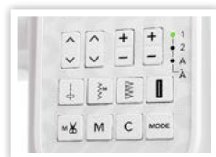
SÉLECTION DIRECTE DU POINT, MÉMORISATION ET COUPE-FIL

Caractéristiques La M200 QDC offre un ensemble de fonctionnalités de luxe, y compris une large sélection de points de piquage et de points pour les appliqués, un alphabet programmable de lettres carrées (parfait pour personnaliser les projets et les étiquettes des courtepentes) et un coupe-fil automatique.