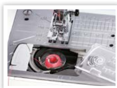
DÉPÔT FACILE DE LA BOBINE